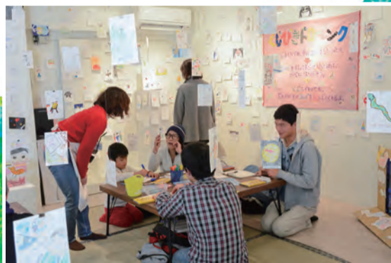
乾久子《くじびきドロイング》2008~