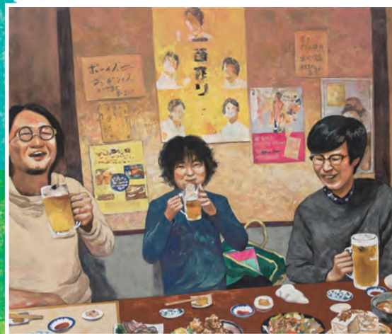
久松 知子《思い出アルバム painting》2017