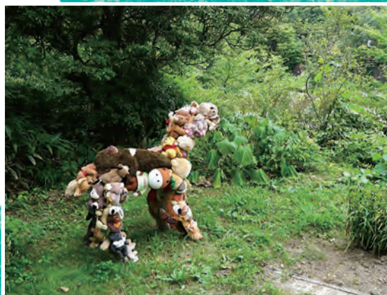
藤 浩志《ヌイグルミーズ/茶色の仔馬》2016