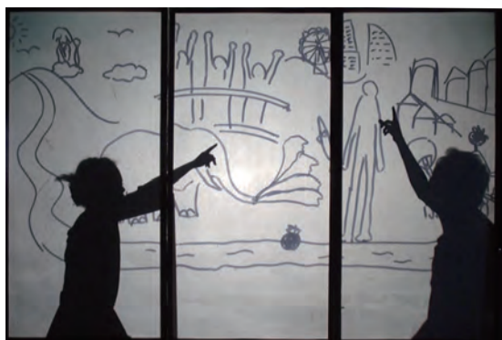
佐藤 悠《いちまいばなし》2011~