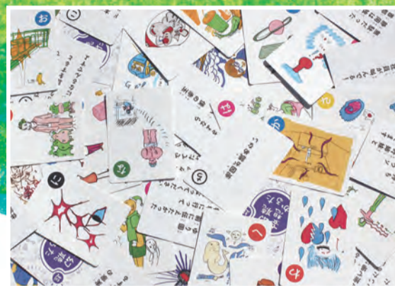
ハーモニー《超・幻聴妄想かるた》2018